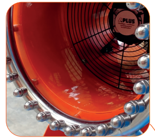
27 buses alimentées par une pompe à eau